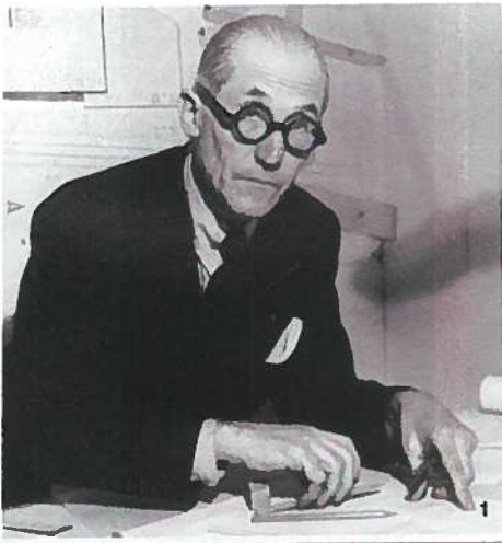
1 Le Corbusier

Het is vijftig jaar geleden dat Le Corbusier overleed en daarom komt deze legendarische architect dit jaar in Frankrijk opnieuw tot leven via een reeks tentoonstellingen, publicaties en retrospectieven. Een landelijk eerbetoon aan dit creatieve genie. Het Centre Pompidou biedt een niet eerder gezien parcours doorheen zijn werk, met een focus op de maat van het menselijk lichaam als universeel principe voor alle dimensies van de ruimtelijke vormgeving. Villa Savoye, een van zijn meesterwerken (1931), biedt tot december een programma rond de noties in de reflectie van deze avant-gardist. En in de Cité de l'Architecture et du Patrimoine wordt de bouw van de nieuwe hoofdstad van de Punjab in India onderzocht. Le Corbusier werkte daar van 1951 tot aan zijn dood aan. Als theoreticus van de moderniteit bracht hij een revolutie in onze manier van wonen teweeg. Hij heeft een onuitwisbare stempel gezet op de 20ste eeuw en is ook vandaag nog een inspiratiebron voor de jongere generaties.