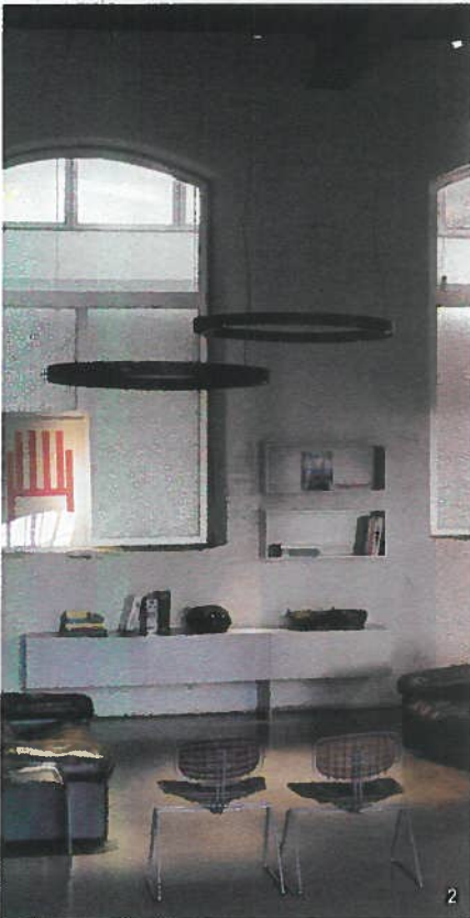
3. Light Years: Lullaby Design: Monica Förster

Inspiré des techniques d'Isamu Noguchi, la suspension en papier fait de calcaire écrasé trouve sa rigidité avec les fines lamelles de frêne.